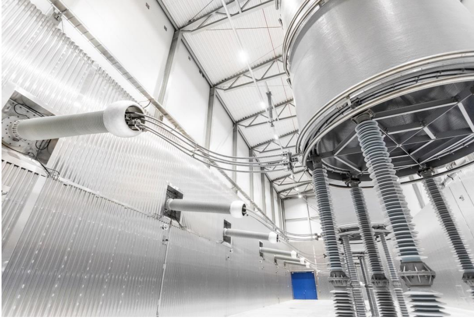
Die NordLink Konverterstation in Tonstad von innen: Hier ein Blick in die Drosselspulenhalle.