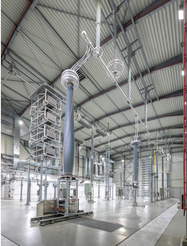
Konverterhalle Wilster mit Kabelendverschluss.