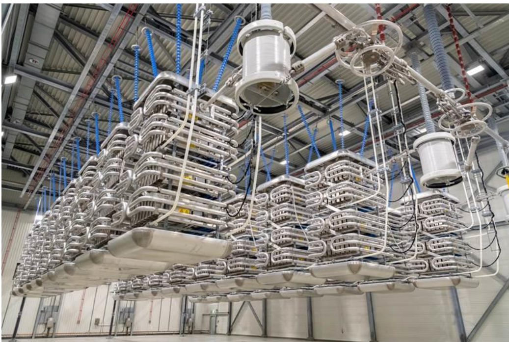
Die NordLink Konverteranlage in Wilster: Ein Blick in die Ventilhalle.