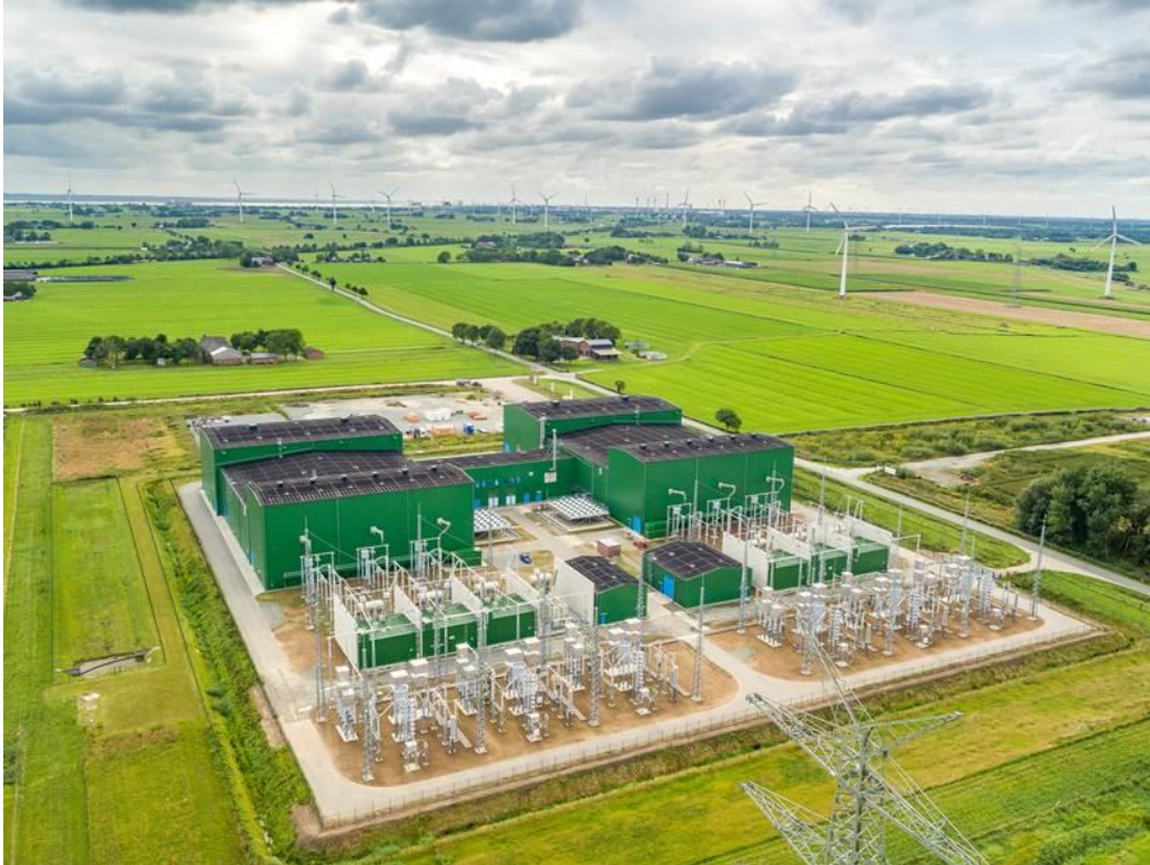
Die fertiggestellte NordLink Konverterstation in Wilster (Deutschland), Sommer 2020.

Wenn Sie die Fotos in höherer Auflösung benötigen, wenden Sie sich bitte an die TenneT Pressestelle unter presse@tennet.eu