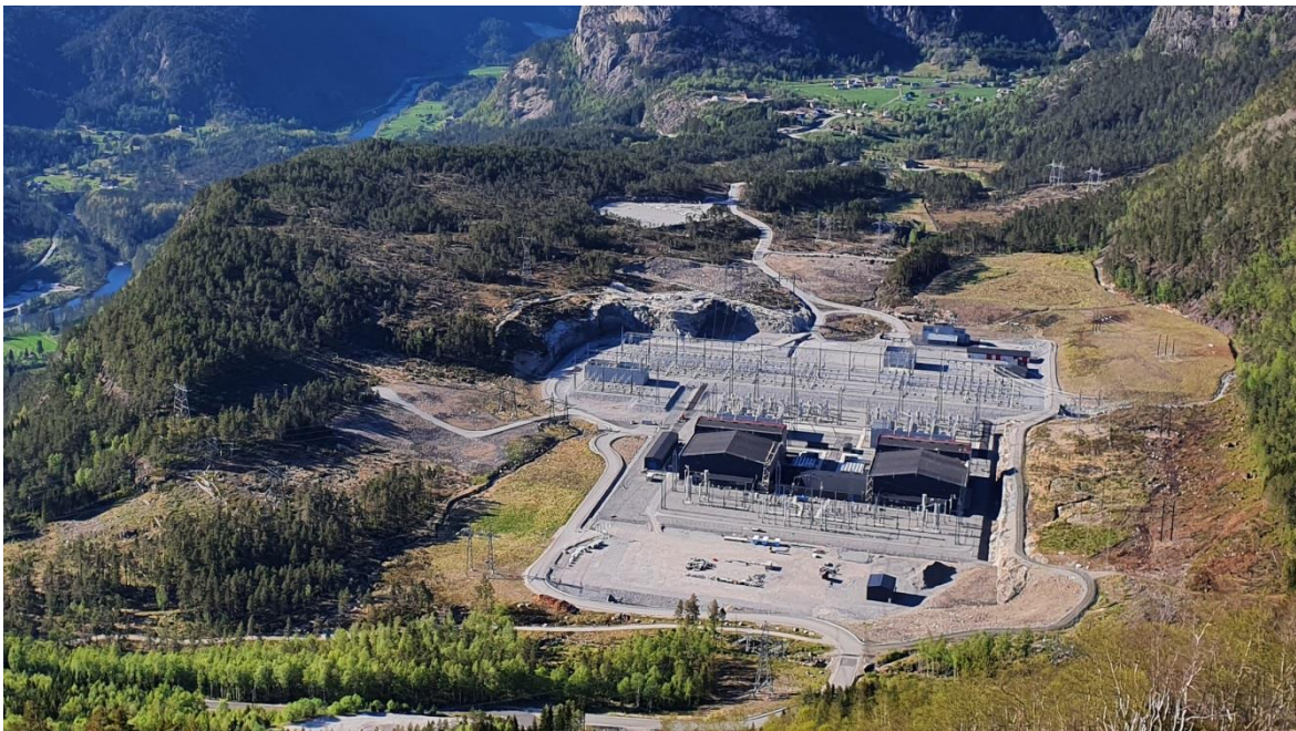
Die fertiggestellte NordLink Konverterstation in Tonstad, Norwegen, Frühjahr 2020.